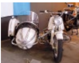
BMW-Motorräder waren früher meistens schwarz, aber es gibt Ausnahmen.