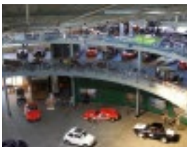
Unten Autos zum Kauf oder zur Miete, mittig eingestellte Sammlerautos und oben die BMWs.