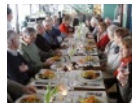
Kein Zufall: Wer alte Autos liebt, hat auch ein Faible für gutes Essen.