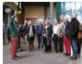
Die SMVC-Mitglieder lauschen den interessanten Ausführungen gespannt.