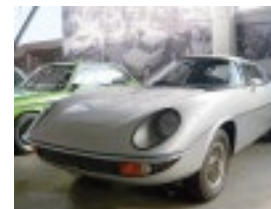
Der Hurricane-Prototyp ist für BMW-Fans eines der Highlights der Sonderausstellung.